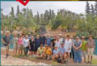
Das war anders geplant – Die Israelreise im Oktober SEITE 14 + 15

WEIHNACHTSKONZERTE u. a. mit WOLF CODERA SEITE 34