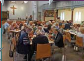
"Volles Haus" und gute Stimmung beim Geburtsstags-Frühstück SEITE 9